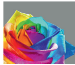
Full Colour HD